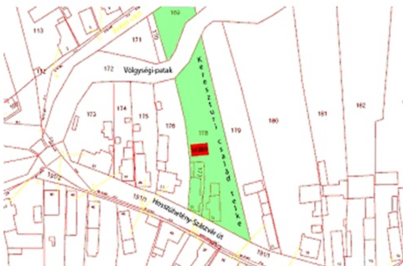
5. kép: A Kereszturi család telke és az istállópajta elhelyezkedése Kárász belterületén