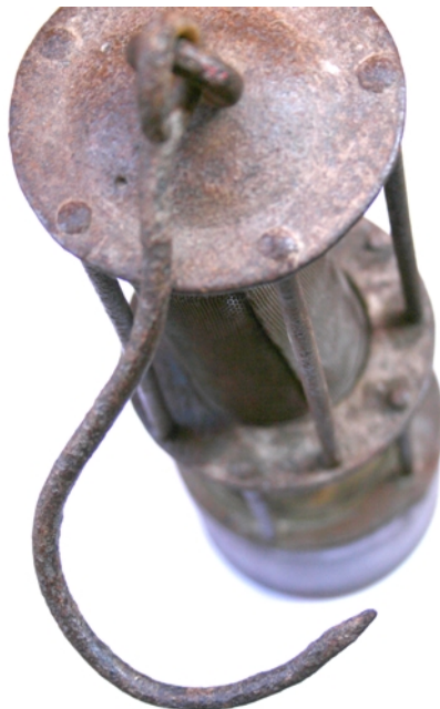
10. kép: Bányáslámpa (Davy-lámpa)

A raktár részben látható a bányáslámpa , ami a kárászi és völgyeségi kamrák jellegzetes eszköze volt. A masszív felépítésű ún. Davy-lámpát különösen kedvelték, ezt használták udvari lámpásnak is. Feltehetően a kárászi köszénbányától, vagy az 1920-21-es években működő aranybánya szerszámos-bódéjából került a Kereszturi család birtokába.