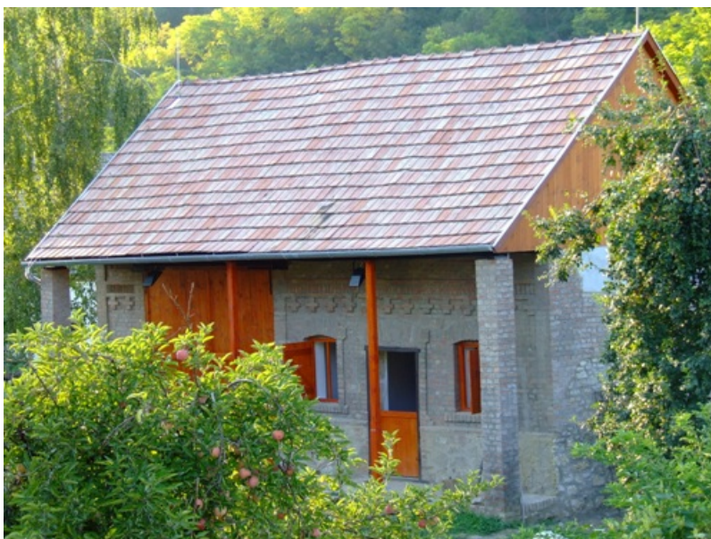
1. kép: A kárászi Istálló Múzeum épülete

A kárászi Istálló Múzeum a baranyai falvak jellegzetes gazdasági épületét, az ún. istállópajtát mutatja be. Ez a sajátos megjelenésű épülettípus egy fedél alatt egyesíti a tároló funkciót betöltő és a cséplésnek helyet adó pajtát és az istállót. Nem csak a megyében jellemző, megtalálható a Dél-Dunántúl nagy részén is, német és magyar falvakban egyaránt. Bár ma már eredeti szerepét ritkán tölti be, jelenléte a falukép szempontjából meghatározó, sok helyütt helyi építészeti védelem alatt áll. Az istállópajták jelenléte különösen akkor látványos és szembetűnő, ha az épületek az udvarral merőlegesen (az utcával párhuzamosan), ún. kereszttelkes elrendezésben épültek. Amennyiben a szomszéd telkeken álló épületek falai a rövidebbik végükkel érintkeznek, úgy az egymáshoz épült istállópajták szinte falszerűen zárják le az udvarokat. Az épülettípus a tejelő állattartás jelentőségének növekedése miatt alakulhatott ki, és nyerhette el a jelenben is látható formáját. Megjelenését a 19. század második felére tehetjük, széleskörű elterjedését nagyban elősegítette a 20. század legelején az állatnevelés és állathízlás (ló és marha) jövedelmezősége.