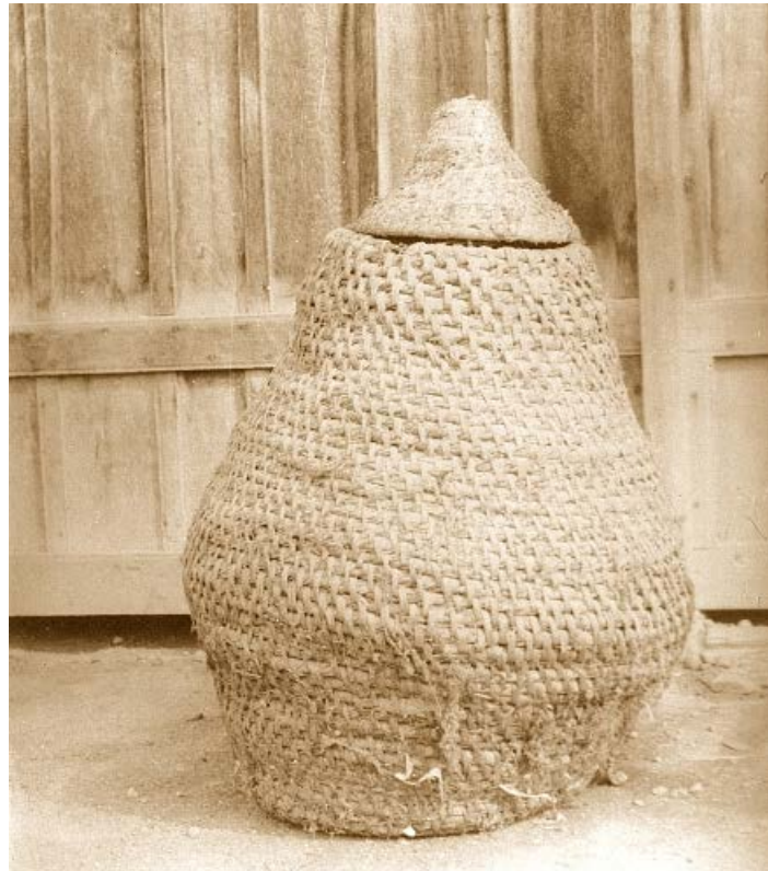
13. kép: A vetőmag tárolására szolgáló zobon

A jószág téli takarmányát (főként a szénát) az istálló padlásán tárolták. A földek kollektivizálása után ez a helyiség is a „régisí tárgyak” gyűjtőhelye lett. A család gazdálkodását korábban alapvetően meghatározó eszközök kerültek ide. Közlekedési eszközök: szekér és lovasszán. A termények betakarítását, szállítását, tárolását szolgáló eszközök: favilla , gereblye , talicska , kosár , szakajtó és a vetőmag tárolására szolgáló zobon . A kendermunkákhoz kapcsolódó tárgyak: tiló , gereben , rokka , motolla . Legvégül pedig a disznóvágáshoz szükséges eszközök: rénfa , forrázóteknő .