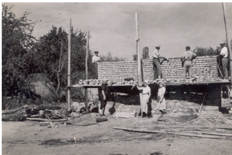
6. kép: Az istállópajta építése 1940-ben