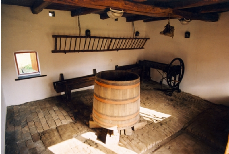
11. kép: Az istálló belső tere a szüretelőkáddal, háttérben a jászollal és a szecs kavágóval a kiállítás kialakítása előtt